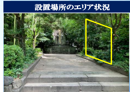
設置場所のエリア状況